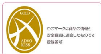
Advo KISS Gold